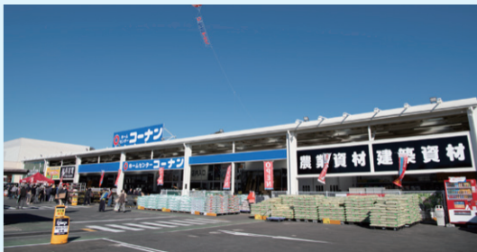
(上) 2023年12月にオープンした「香西本町店」