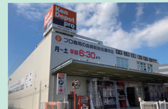
2023年11月にオープンした「建デポ博多上牟田店」

株式会社建デポは首都圏を中心に展開するプロ顧客向け会員制建築資材卸売業です。2019年6月に同社を当社グループに迎え入れ、2023年度には新店を8店舗オープンし、店舗数は80店舗に到達しました。売上及び利益ともに着実に成長し、当社グループにとってますます重要な位置付けを占めるようになっていきます。新たな取組みとして、法人向けECサイト及び建築資材や道具のアウトレット店などの新規事業にもチャレンジしています。今後も売上ならびに安定収益を確保し、より一層当社グループのシナジー効果を創出できるよう継続的努力をまいります。