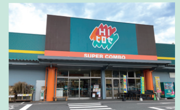
ホームセンターと食品スーパーを併設した「スーパーコンビ白杣店」

株式会社ホームインブルーメントひろせは、九州地方においてホームセンター、プロ及び食品店舗事業を32店舗展開しております。2023年6月に同社を当社グループに迎え入れ、九州における店舗網拡大につながりました。当社は、同社の強みを活かしたシナジー効果を創出し、九州のドミナント拡大と食品スーパー部門のノウハウ蓄積により更なる業容拡大を目指してまいります。