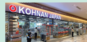
2023年7月にオープンした「ソラガーデン店」(ベトナム ビンズン省)

2016年7月にベトナム社会主義共和国へ、2022年7月にカンボジア王国へそれぞれ1号店をオープンいたしました。ベトナムにおいては、2023年度に新店を2店舗オープンしております。品揃えの充実や店舗改装等も進め、売上・利益の最大化を目指してまいります。