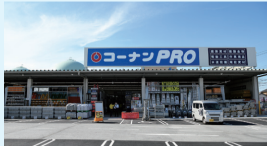
2023年10月にオープンした「PRO新守山店」

プロのお客様の厳しい目に応える専門性の高い資材、塗料、作業用品などを幅広く品揃えするプロ向け専門店です。近年は売場面積300坪～500坪クラスの小型店の出店も強化し、都市部でも出店しやすい店作りで幅広い店舗展開を行っています。