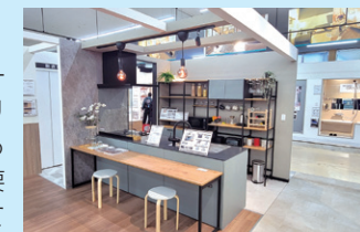
2024年3月に改装オープンした鎌倉大船店のカスタムリフォームコーナー